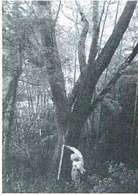
山桜の計測作業風景

今回で三年目、三回目の保内地区の里山における樹木調査を行いました。前回までは全般的な樹木の種類を調べましたが、今回は山中には山桜が多く点在しているので山桜の調査を行いました。保内地区の山桜は、江戸時代から明治にかけて植栽されたもので古いもので樹齢四百年の木を見ることもできます。開花時期は吉野桜より半月遅れで満開となり、五月五日前後となります。調査結果は樹齢四百年の木が一本、三百年が三本、百五十年が十本となりました。今回は仕事のいそがしい時期でもあり、少人数での調査となりましたが今後とも支部会員の方々の協力を得ながら続けて行きたいと思えます。調査場所は保内トレッキングコース（中部北陸遊歩