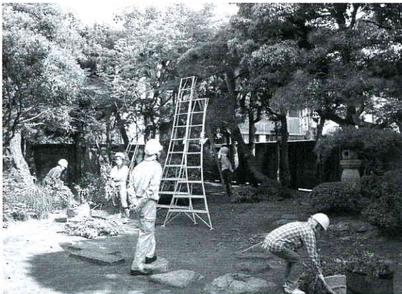
庭園実技講習会の様子（砂丘館にて）

剪定や冬囲い等の講習会を行っています。三社の代表講師と二十人前後の一般の方々とレベルに合わせたグループを作り、半日もしくは、まる一日をかけて、基本技術から応用テクニックまでを講習しています。